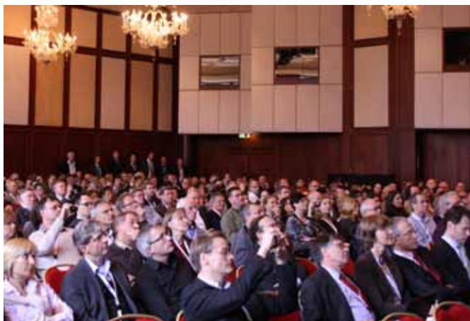
Fig 2 Over 430 participants take part in the congress.