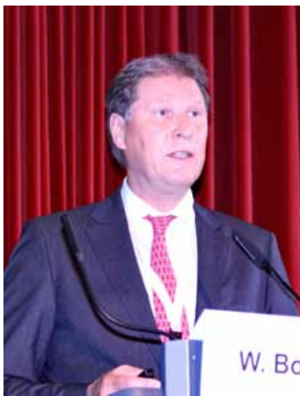
Fig 5 Dr. Wolfgang Boisserée.