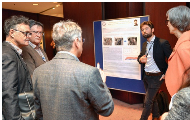
Fig 10 Lively discussions during the poster session.