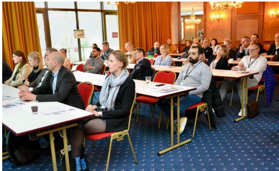
Fig 18 The interesting seminars were again well attended.

Abb. 17 Dr. Kares (rechts) empfing stellvertretend für die gesamte Arbeitsgruppe den Alex-Motsch-Preis (Practice).