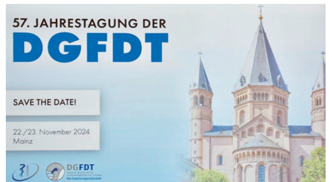
Fig 20 See you in Mainz in 2024.