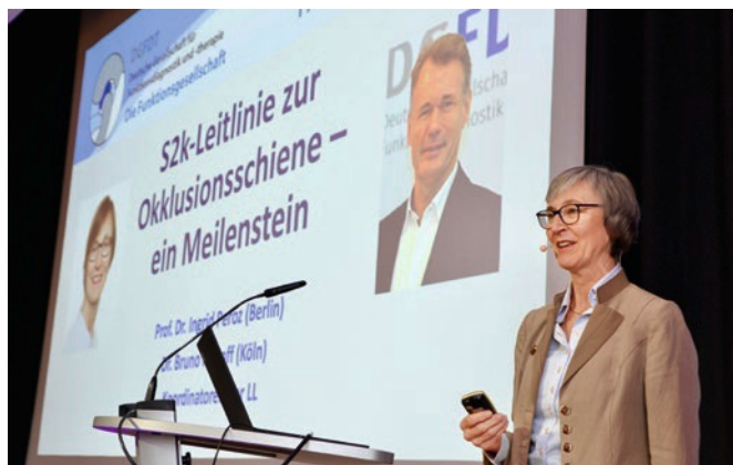
Fig 2 Prof. Peroz started with the first keynote speech.