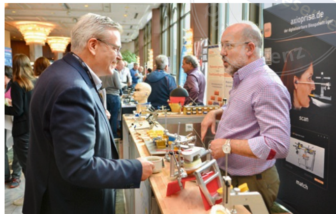
Fig 6 The industry exhibition was well attended.