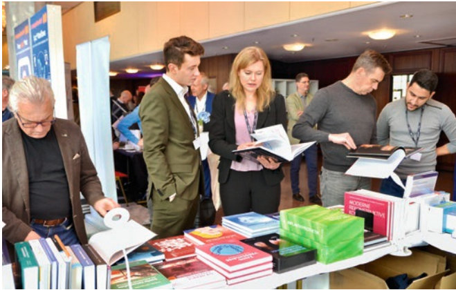
Fig 7 The breaks were also used for further training.

Abb. 7 Auch die Pausen wurden zur Fortbildung genutzt.