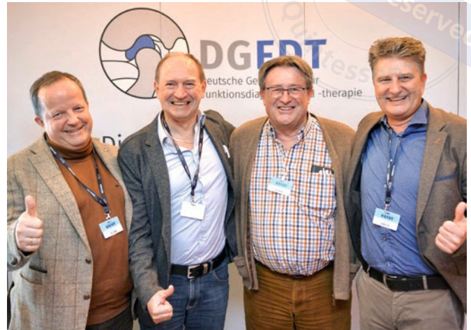
Abb. 9 Die gute Stimmung unter den Teilnehmern spricht für eine gelungene Tagung.